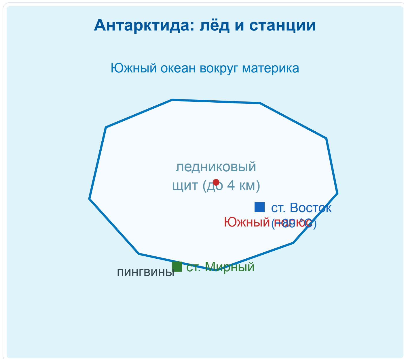
Рис. 1. Антарктида под ледниковым щитом; полюс холода — станция Восток