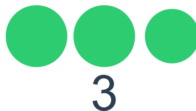
Рис. 1. Каждый раз прибавляем по одному: 1, 2, 3