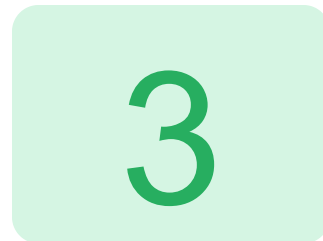
Рис. 2. Цифры 1, 2, 3

⚠️ Не путай: цифру 2 и цифру 3. У двойки внизу прямая черта-«ножка», а у тройки — два круглых пузатых выступа справа.