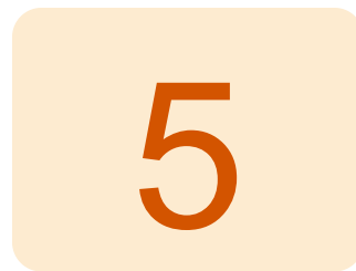
Рис. 3. Цифры 4 и 5