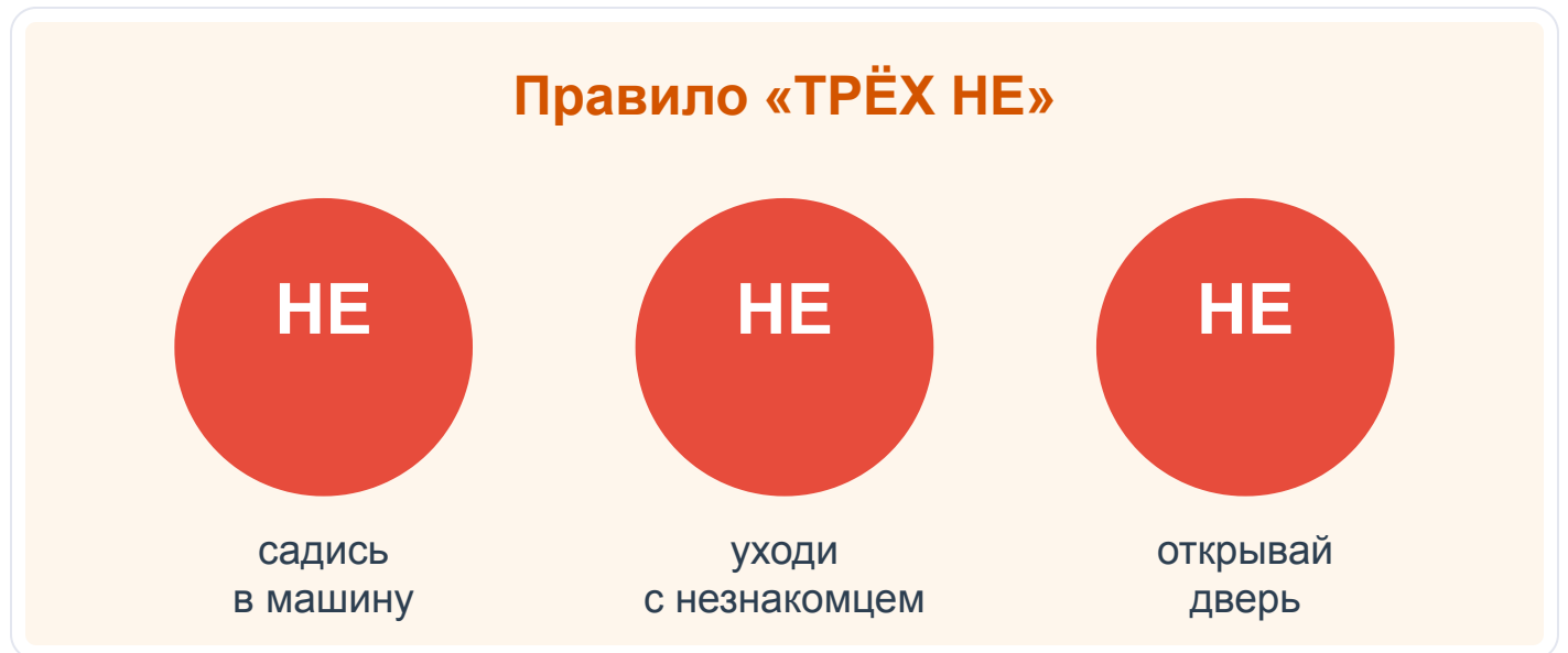
Рис. 1. Правило «трёх НЕ» при встрече с незнакомцами

Это три железных запрета. Запомни их так крепко, чтобы они срабатывали сами, без раздумий.