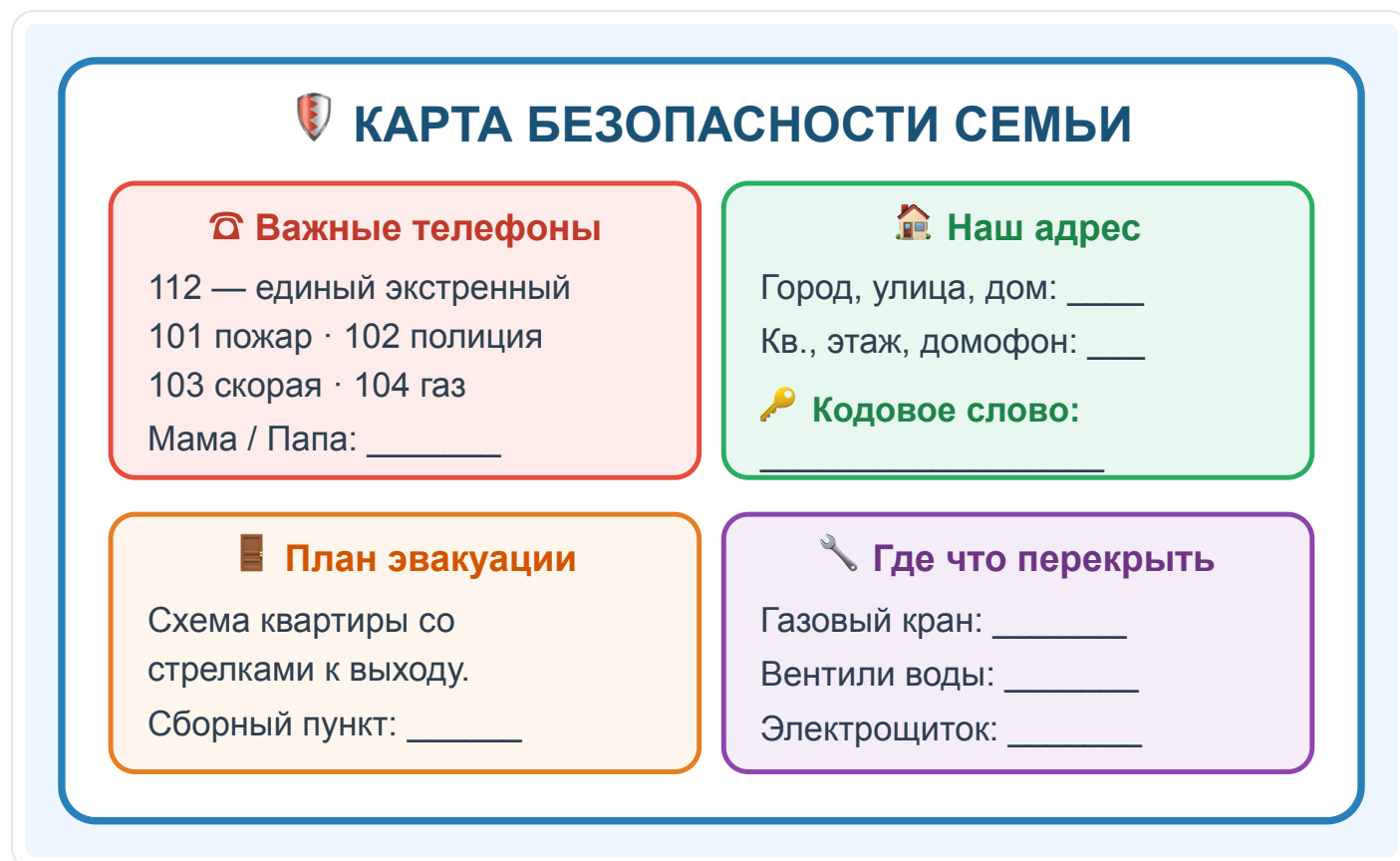
Рис. 1. Образец «Карты безопасности семьи»: телефоны, адрес, кодовое слово, план, перекрытия

Теперь соберём это в твою личную карту. Вот как она выглядит: