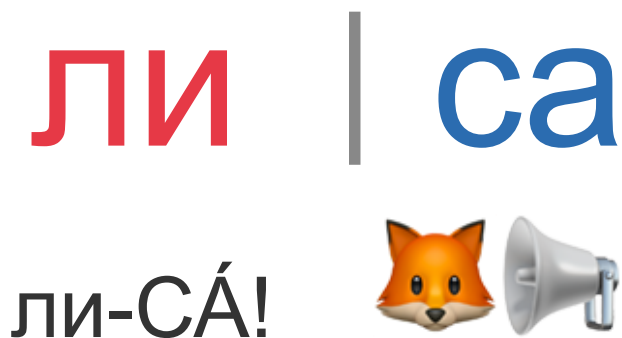
Рис. 1. Зовём слово «лиса» — громче слог СА, на нём ударение.

💡 Запомни: Ударный слог звучит громче и дольше. Чтобы найти ударение — позови слово! 📣