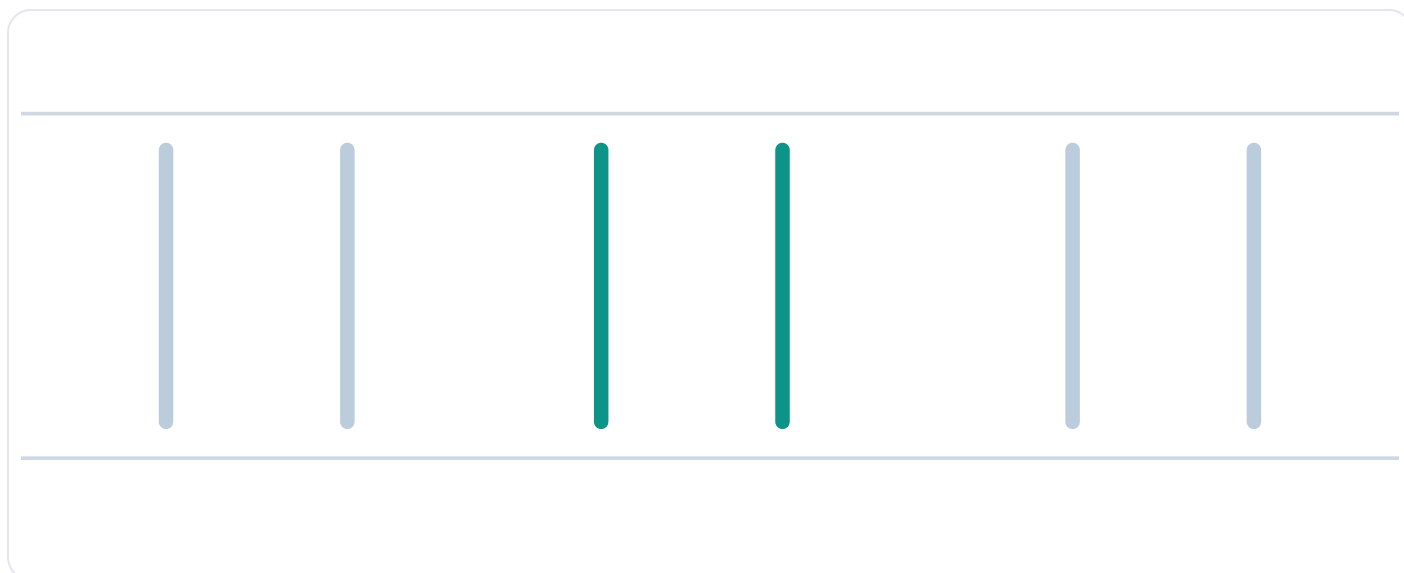
Рис. 1. Обведи бледные палочки, потом напиши сам

Шаг 2. Теперь рядом нарисуй такие же палочки сам, ровно сверху вниз ⬇️ .